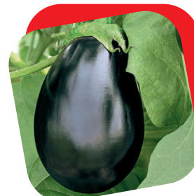
Melanzana tonda nera

Pianta a portamento eretto, medio alta ad internodi corti con grande facilità di allegagione. I frutti lunghi oltre 20 cm sono dritti e pesanti, con polpa molto carnosa, liscia e spessa di colore rosso intenso a maturazione. Ciclo medio precoce, adatto alla coltivazione sia in serra che a pieno campo. È la varietà ideale come peperone da cuocere sulla griglia. Ottimo anche per la conservazione sott'aceto.