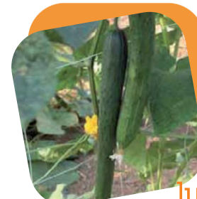
Cetriolo lungo olandese

Varietà di media vigoria, con capacità di produrre molti frutti con uno standard elevato di qualità. I frutti sono lunghi e di grossa pezzatura (12/17 kg) con striature di colore brillante che sono sinonimo di freschezza. La polpa è fine e croccante, di colore rosso vivo con pochi semi. La grande adattabilità unita alla capacità di allegagione permette la coltivazione anche con trapianti anticipati. L'innesto ne esalta la produttività e il peso medio dei frutti.