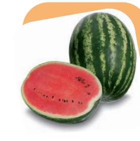
Anguria lunga striata

Varietà di media vigoria, con capacità di produrre molti frutti con uno standard elevato di qualità. I frutti sono lunghi e di grossa pezzatura (12/17 kg) con striature di colore brillante che sono sinonimo di freschezza. La polpa è fine e croccante, di colore rosso vivo con pochi semi. La grande adattabilità unita alla capacità di allegagione permette la coltivazione anche con trapianti anticipati. L'innesto ne esalta la produttività e il peso medio dei frutti.