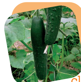
Cetriolo classico italiano

Pianta molto vigorosa adatta per raccolte medio-tardive, sia in tunnel che in pieno campo. Frutti con buccia rugosa di colore giallo, polpa bianca dolcissima, pezzatura grossa oltre i 2 kg. Ideale per aggiungere alle macedonie un tocco esotico e la dolcezza della tradizione del sud.