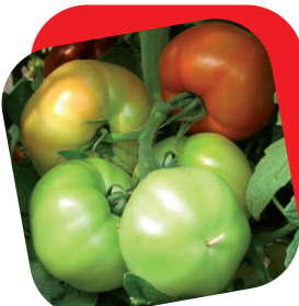
Pomodoro tondo liscio

La vera macchina da cetrioli. Questa varietà è senza dubbio la più produttiva in assoluto. La pianta, molto vigorosa è prolifica di fioriture partenocarpiche, che portano alla formazione di numerosi frutti di grande qualità e omogeneità. Ottima anche la conservabilità. Grazie alla sua struttura e all'innesto si presta molto bene anche alle produzioni tardive.