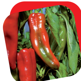
Peperone corno rosso

Pianta molto vigorosa. Produce splendidi grappoli con 10/15 frutti dal sapore dolcissimo, polposi e saporiti del peso di 15/20 gr. A forma di dattero. La buccia è estremamente sottile di un bellissimo colore rosso brillante. L'alto contenuto di licopene gli conferisce un sapore particolare. Ottimo sia fresco sia da sugo.