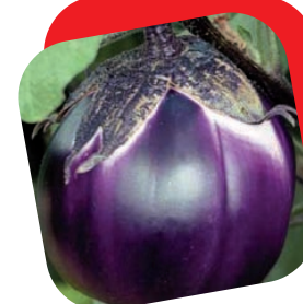
Melanzana tonda viola

Pianta eretta, vigorosa e coprente, grazie all'innesto estremamente produttiva. Adatta alla coltivazione sia in serra che in pieno campo. Frutti di un bel colore giallo lucente con polpa spessa e sapore dolce. Ottimo per tutte le cotture, ma soprattutto per il consumo crudo.