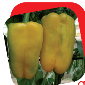
Peperone quadrato giallo

Pianta molto vigorosa e ben coprente. Ottima l'allegagione su tutti i palchi. Frutti di ottima pezzatura e grappoli molto omogenei. Colore rosso vivo, ottimo il gusto.