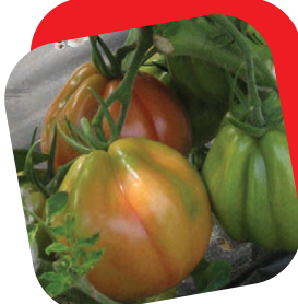
Pomodoro cuore di bue "ligure"

Tipico della zona ligure, questo cuore di bue presenta il caratteristico colore rosato, che deriva dalla maturazione che avviene dall'interno verso l'esterno del frutto, questo elimina il problema del torsolo bianco, e conferisce al frutto un sapore straordinario. Utilizzato nella caprese ci riporta ai sapori di una volta.