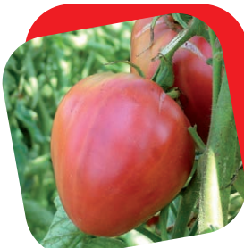
Pomodoro cuore di bue "classico"

La tipologia di anguria più diffusa in Italia. Pianta vigorosa, ciclo medio e grande produttività. Frutti di pezzatura media 6/8 kg molto uniformi. La buccia striata è sottile, e la polpa di un bel colore rosso è croccante e dolce.