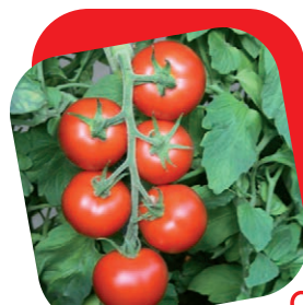
Pomodoro grappolo rosso

Frutto ovale, caratterizzato da colore rosso, e sapore intenso. La resistenza alle spaccature e la grande produttività rendono la varietà particolarmente adatta per le produzioni tardive. L'abbinamento con l'innesto consente di allungare di molto il ciclo colturale. Vista la sua consistenza è perfetto per il gratin. Ottimo anche per la salsa.