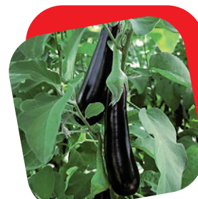
Melanzana lunga nera

Pianta con ottima vegetazione, coprente e grazie all'innesto molto rustica. Nel suo lungo ciclo produce numerosi frutti quadrati, grossi, carnosissimi e dolci. Il più voluminoso di tutti i peperoni e nel contempo il più precoce. I frutti virano al giallo a completa maturazione. Visto il sapore dolce e lo spessore della polpa è il migliore peperone per il gratin.