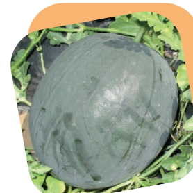
Anguria sugar baby

Il classico melone italiano. Ciclo medio e grazie all'innesto pianta molto vigorosa e resistente. Frutti ben retati di pezzatura media con fetta marcata, polpa arancio intenso e classico sapore dolce ed aromatico. Voi pensate al prosciutto al melone pensiamo noi.