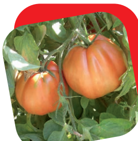
Pomodoro pera d'abruzzo

La tipologia di anguria più precoce in assoluto. L'innesto consente di allungarne il ciclo di produzione. Frutti di colore nero lucido, di pezzatura media, con polpa rosso intenso, molto zuccherina e soda. Adatta alla coltivazione in serra, tunnelino e pieno campo.