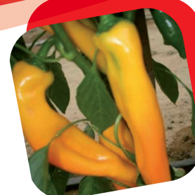
Peperone corno giallo

Il tipico pomodoro "Vesuviano", dai frutti leggermente appuntiti con peso di 30/40 gr. e di un meraviglioso colore rosso vivo. La pianta molto vigorosa è estremamente produttiva con numerosi grappoli di 15 - 20 frutti. I frutti molto saporiti portano nei sughi per gli spaghetti e nelle salse per la pizza tutto il sole di Napoli.