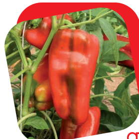
Peperone quadrato rosso

Varietà abbastanza vigorosa, con internodi corti e palchi fiorali doppi. Frutti costolati di grandi dimensioni, buona consistenza del frutto sia all'invaiaura che a maturazione. Sapore gradevole e aroma delicato, classico per l'arrosto alla griglia.