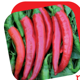
Peperone piccante lungo

La varietà del tipo quadrato rosso ha mesocarpo molto spesso e dolce. L'uniformità dei frutti sulla pianta, e l'alta robustezza del suo apparato vegetativo, lo rendono adatto alla coltivazione, sia sotto tunnel che in pieno campo. I frutti che possono essere raccolti anche al verde, virano al rosso a completa maturazione.