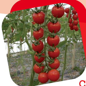
Pomodoro ciliegino rosso

Tipico della zona ligure, questo cuore di bue presenta il caratteristico colore rosato, che deriva dalla maturazione che avviene dall'interno verso l'esterno del frutto, questo elimina il problema del torsolo bianco, e conferisce al frutto un sapore straordinario. Utilizzato nella caprese ci riporta ai sapori di una volta.