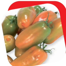
Pomodoro san marzano

Il frutto dall'inconfondibile forma di cuore è di ottima pezzatura (200/280gr), adatto alla coltivazione sia in serra che in pieno campo. L'abbinamento con l'innesto esalta la produttività e la resistenza alle malattie. Visto il suo caratteristico sapore dolce consigliamo il consumo crudo con olio e basilico.